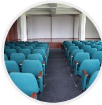
AUDITORIO JORGE PEREZ CONCHA