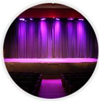
TEATRO JOSÉ MARTÍNEZ QUEIROLO