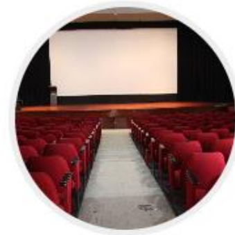
SALA DE CINE “ENRIQUE GIL CALDERON”